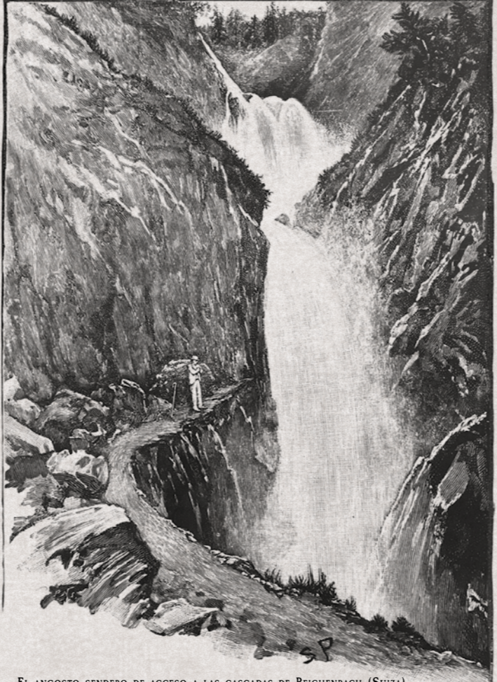
EL ANGOSTO SENDERO DE ACCESO A LAS CASCADAS DE REICHENBACH (SUIZA).

Allí podría permanecer tendido con absoluta comodidad, y oculto a las miradas. Allí estaba yo cuando Watson investigaba de la manera más ineficaz las circunstancias de mi muerte. Pensé que mis aventuras ha-