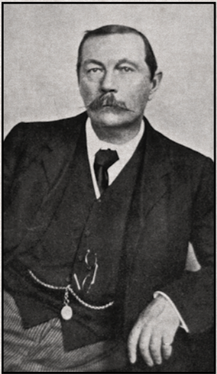
SIR ARTHUR CONAN DOYLE

LONDRES. - Hace solo unos meses que Arthur Conan Doyle regresaba de su misión voluntaria a Sudáfrica, en su doble condición de médico y escritor, y nos regalaba su interesantísimo ensayo La Gran Guerra Bóer , gracias al cual los británicos de la metrópoli hemos podido conocer de primera mano la dureza de la contienda entre el Imperio Británico y los colonos africanos. "Me sentía feliz porque siempre quisiera recibir un bautismo de fuego. No sentí ningún tipo de nerviosismo. Y eso lo debo al hecho de haber mantenido la mente enfocada en otros asuntos", explicó Conan Doyle, ya en Londres, feliz por el éxito de su ensayo bélico.