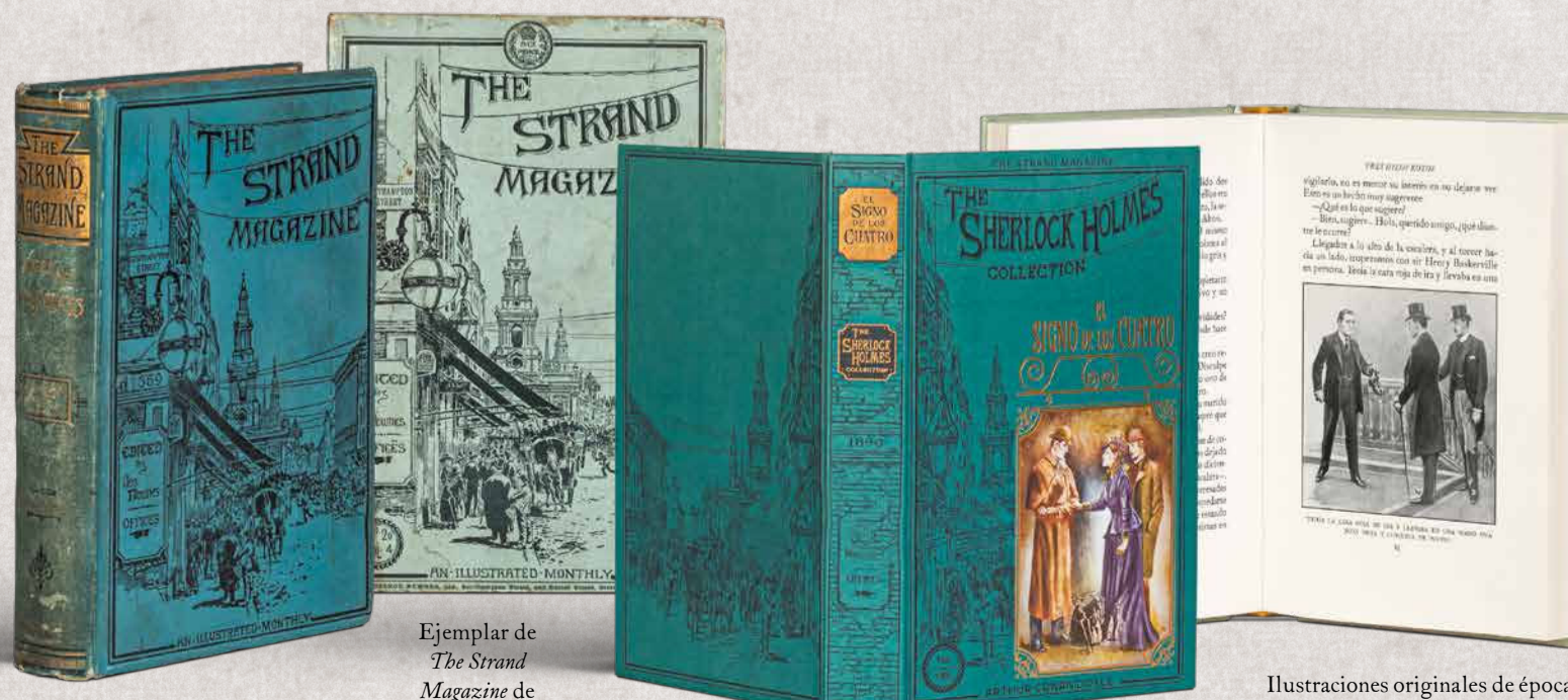
The Strand Magazine encuadernada, año 1894

Una perspectiva de la avenida The Strand, en una de cuyas esquinas se hallaba la publicación, ilustraba la portada original de la revista, cuya cabecera colgaba de los cables del telégrafo. Nuestra colección reinterpreta esa ilustración para sus cubiertas.