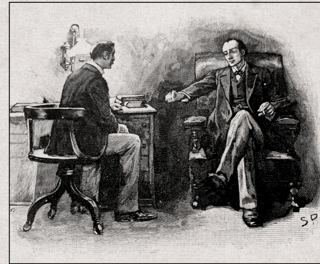
EL DOCTOR WATSON Y SHERLOCK HOLMES, DURANTE EL ENCUENTRO CON THE STRAND CHRONICLE.

Hasta hoy mismo, la versión oficial contaba que Holmes y su gran rival, el malvado Moriarty, habían caído por el borde de vertiginosas acantilados de Reichenbach mientras luchaban cuerpo a cuerpo. Según contó Watson desde el lugar de los hechos, nadie puede sobrevivir a una caída desde tal altura. Y el médico realizó sus propias comprobaciones, deduciendo que ambos habían muerto tras precipitarse al vacío. "Eso era lo que pensaba... hasta hace solo unas semanas", comenta emocionado John Watson a The Strand Chronicle . "Fue entonces cuando conocí a un colec-